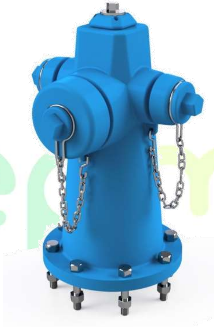
Figura 1. Cuerpo superior hidrante