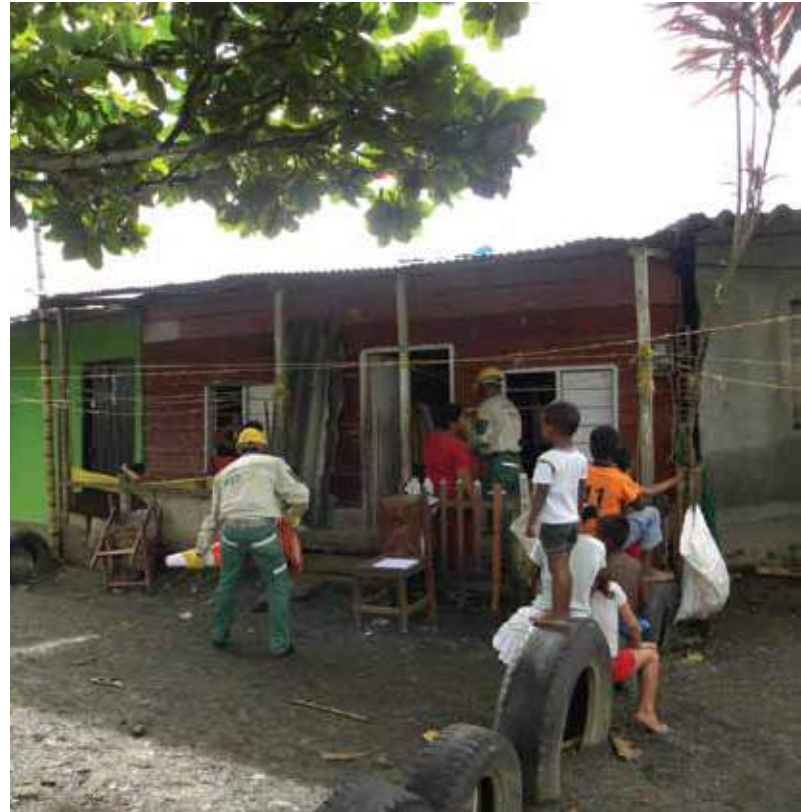
Primera instalación de energía prepago en Urabá.

Al 31 de octubre de 2010, las viviendas electrificadas sumaban 25.553, y al finalizar el año se habrá alcanzado la meta de 28.000.