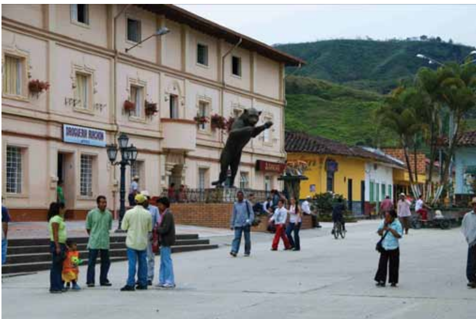
Municipio de Amalfi.

Aguas del Nordeste es una muestra del compromiso de EPM con Antioquia y el país.