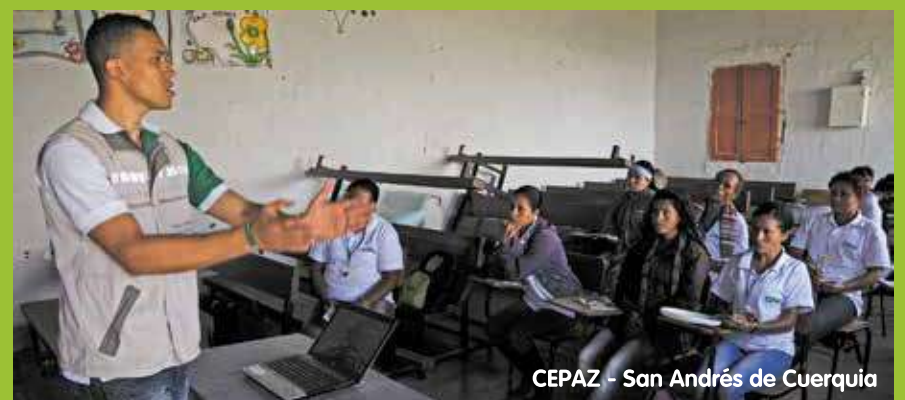
CEPAZ - San Andrés de Cuerquia

Para que entre todos, hagamos de la legalidad el mejor escenario para la construcción de oportunidades, para juntos derrotar la violencia, para que la paz y el respeto sean nuestro himno.