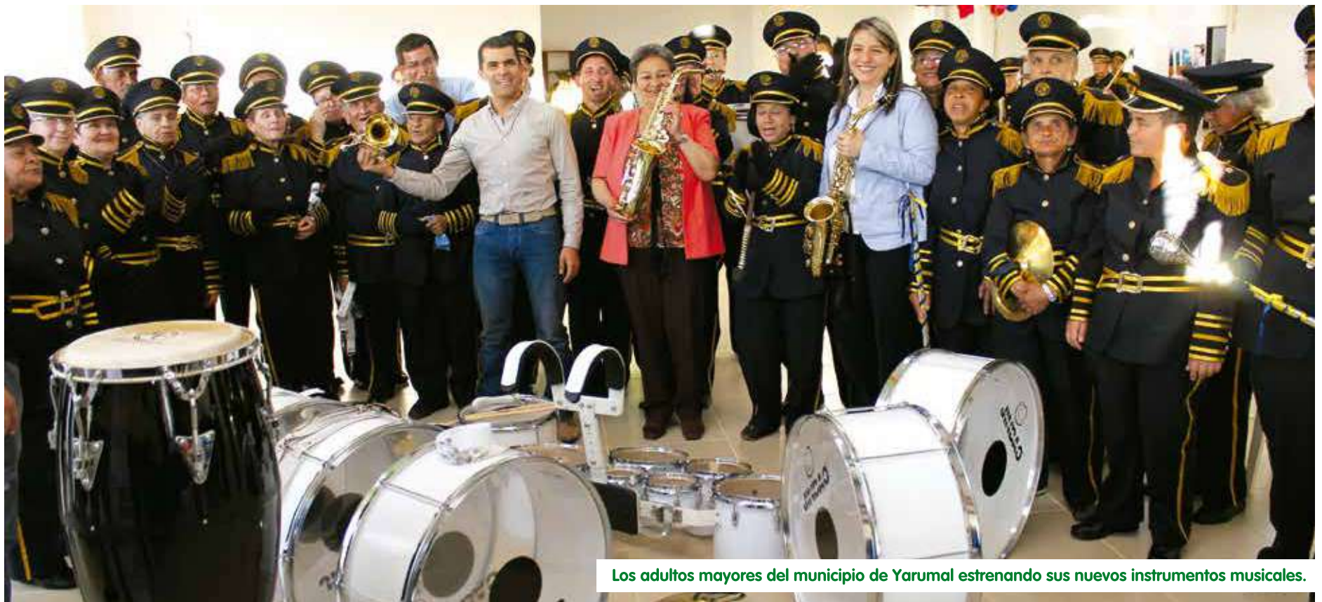
Los adultos mayores del municipio de Yarumal estrenando sus nuevos instrumentos musicales.

Para aprender juntos a tomar decisiones en beneficio del territorio y juntos encontremos prioridades, para que los recursos económicos de nuestros municipios se manejen con responsabilidad y transparencia.