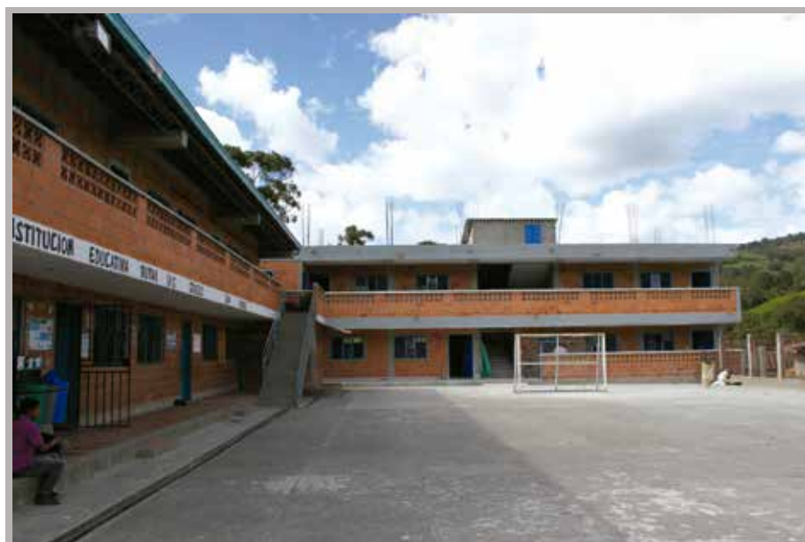
Institución Educativa Rural Las Cruces - San Andrés de Cuerquia