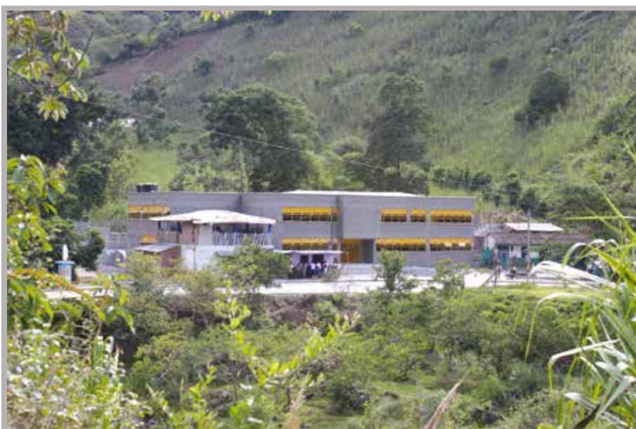
Institución Educativa Rural Ana Joaquina Restrepo - Vereda Alto Seco San Andrés de Cuerquia