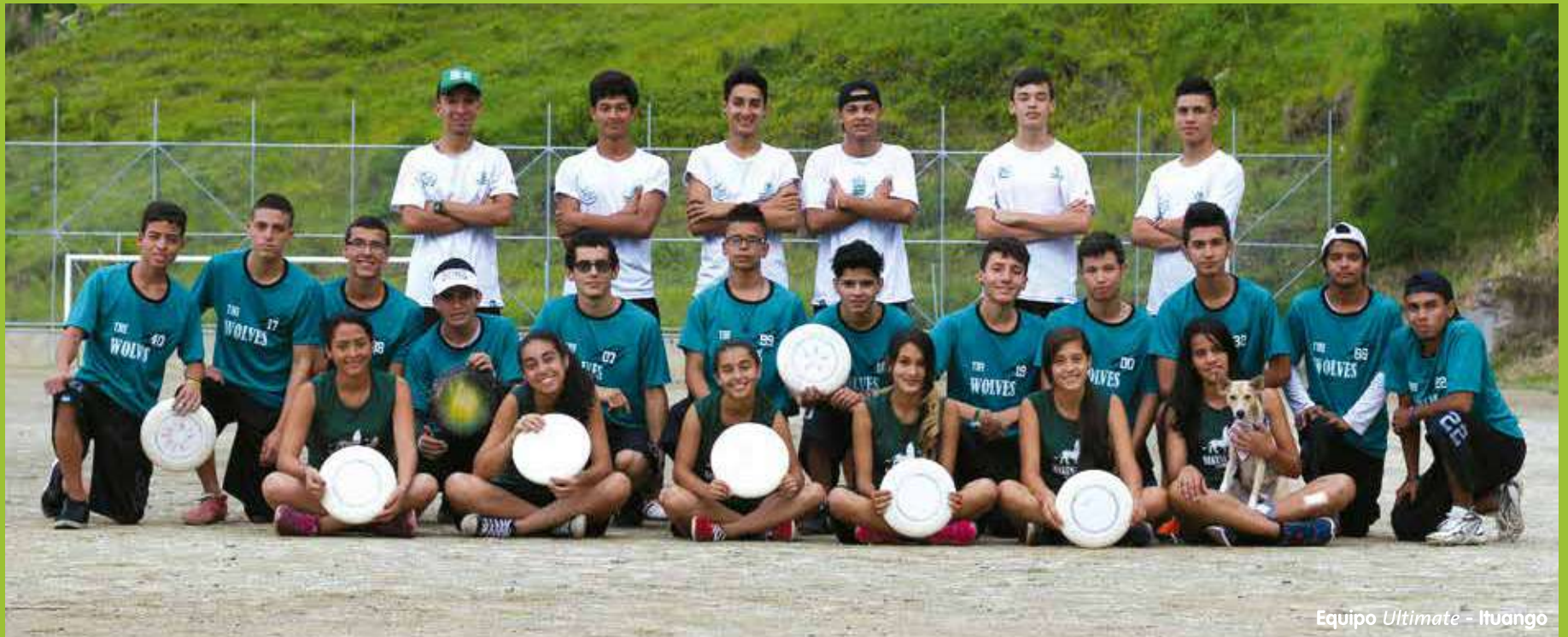
Equipo Ultimate - Ituango