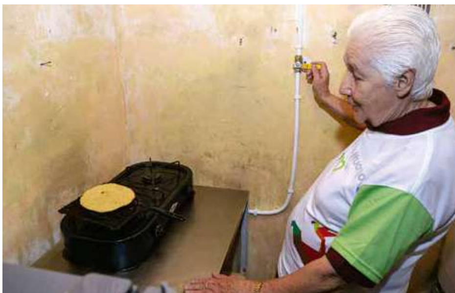
Habitantes de Ituango ya disfrutan del gas natural

Para brindar mayor calidad de vida. Energía eléctrica, gas, agua potable al alcance de todos los habitantes del área de influencia, se convierten así en una garantía de construcción conjunta de bienestar colectivo.