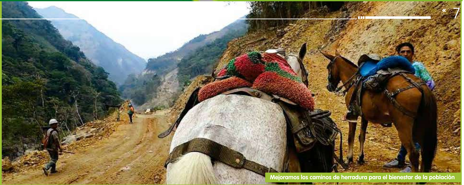
Mejoramos los caminos de herradura para el bienestar de la población